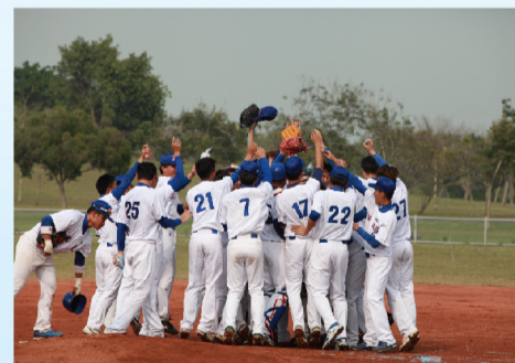
確定拿下冠軍，球員衝出休息區，歡呼慶祝。