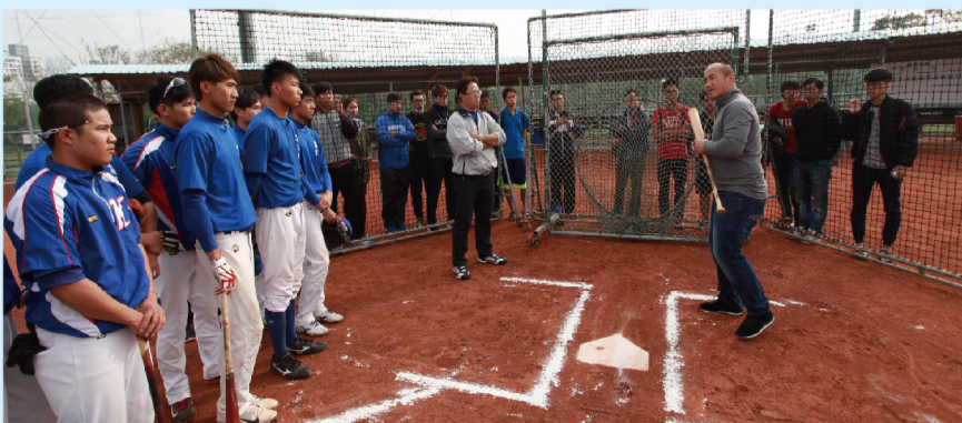
明星球員 - 張泰山蒞臨本校指導棒球隊。

中華職棒知名球星張泰山蒞校專題演講，與運動競技學系棒球隊學生分享職棒路上努力與堅持，並一一指導每位運技系棒球組學生打擊技巧，如善用手腕、腰部、臀部力量，掌握對方投手投球節奏，透過實際指導後輩打擊技巧，也讓選手受益良多。