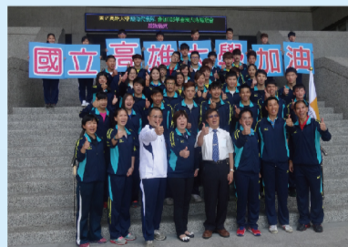
國立高雄大學金厲害，在105年全大運表現亮眼。