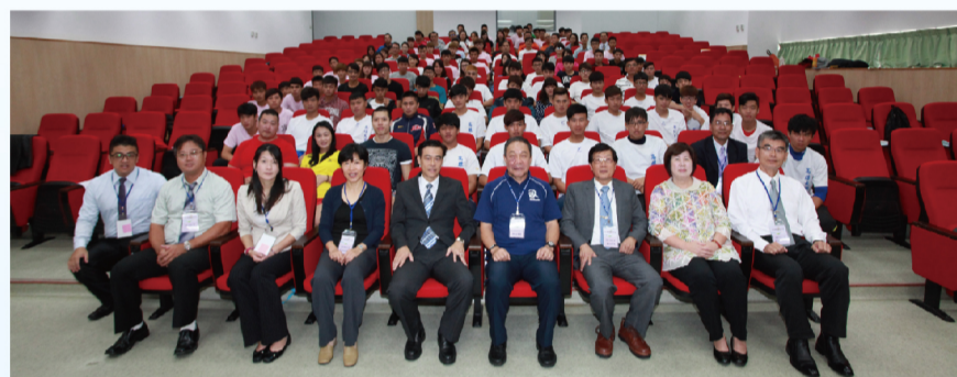
運動訓練科學研討會圓滿落幕，與會貴賓與學生合影。

運動訓練科學研討會共進行兩天，探討包括運動教練學、運動訓練學、運動管理學、運動教育學、運動生理學、運動生物力學、運動心理學、運動醫學與保健、運動資訊、體育測驗與評量等科學的整合，以及健康體適能的發展、休閒產業規劃與管理等多項議題，同時發表13篇論文。